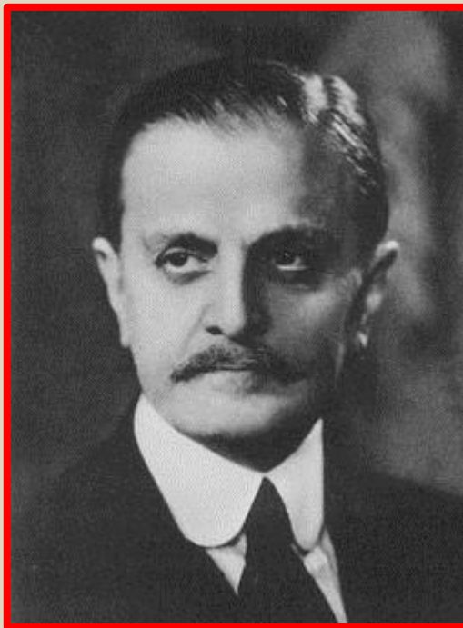
Buenos Aires, Argentina, 1 de noviembre de 1878. Ibídem, 5 de mayo de 1959.

En: https://es.wikipedia.org/wiki/Carlos_Saavedra_Lamas , recuperado 21-10-2020